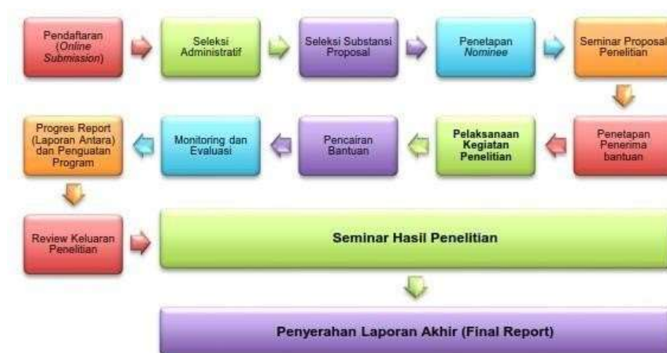
Gambar 3.1. Alur Proses Pengelolaan Penyelenggaraan Bantuan Penelitian dan Publikasi Ilmiah